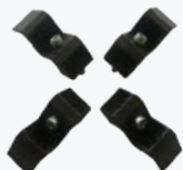
Set protezioni cerchi Alu Set of 4 jaws for alloy rims