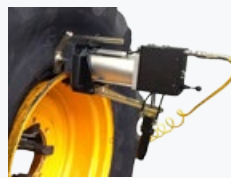
Premi tallone pneumatico Pneumatic bead pressing device