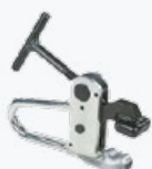
Morsetto per cerchi Alu Alloy rims clamp