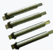
Set di 4 estensioni 42"-60" Set of 4 extensions 42"-60"