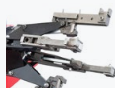
Adattatore per ruote EM e OTR EM and OTR wheels adapter